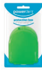
ESTOJO APARELHO E DENTADURA POWERBOX 7898940257652