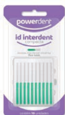
ESC.D.INTERDENT FINA VERDE 4MM 7898940257362