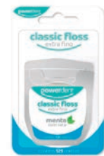
FIO DENTAL POWERCLASS EXTRA FINO 125M 7898940257478