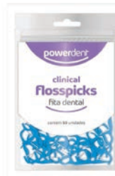
FITA DENTAL FLOSS PICK ADULTO C/50 7898585290953