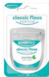
FIO DENTAL POWERCLASS 125M 7898940257430