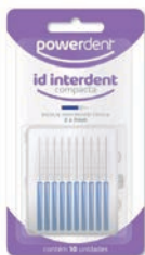
ESC.D.INTERDENT CONICA AZUL 3 A 7MM 7898940257379