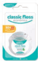
FIO DENTAL CLASSIC FLOSS 50M+25M GRATIS 7898585291868