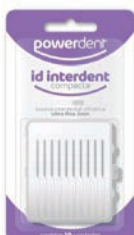
ESC.D.INTERDENT ULTRA FINA BRANCA 2MM 7898940257348