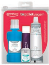
KIT POWERDENT VIAGEM 7898585291592