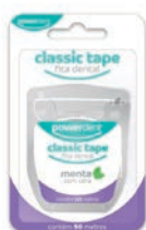
FITA DENTAL POWERCLASS 90M 7898585290601