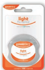
FIO DENTAL POWERDENT LIGHT 100M 7898940257577