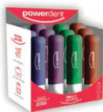
ESC.D.POWERDENT POWERTRIP DISPLAY C/12 7898940257867