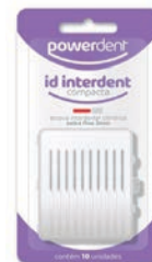
ESC.D.INTERDENT EXTRA FINA VERMELHA 3MM 7898940257355