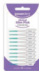
ESC.D.INTERDENT SLIM PICK C/10 7898585293381