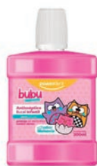
ENX.BUCAL INF. BUBU MELANCIA 300ML 7898585294043