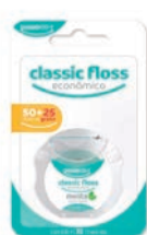
FIO DENTAL CLASSIC FLOSS 50M+25M GRATIS 7898585291868