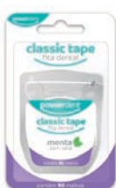
FITA DENTAL POWERCLASS 90M 7898585290601