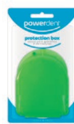
ESTOJO APARELHO E DENTADURA POWERBOX 7898940257652