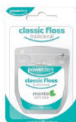
FIO DENTAL POWERCLASS 125M 7898940257430