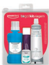
KIT POWERDENT VIAGEM 7898585291592