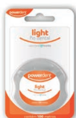
FIO DENTAL POWERDENT LIGHT 100M 7898940257577