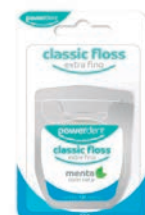
FIO DENTAL POWERCLASS EXTRA FINO 125M 7898940257478