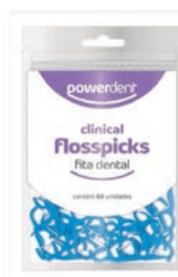
FITA DENTAL FLOSS PICK ADULTO C/50 7898585290953