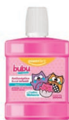
ENX.BUCAL INF. BUBU MELANCIA 300ML 7898585294043